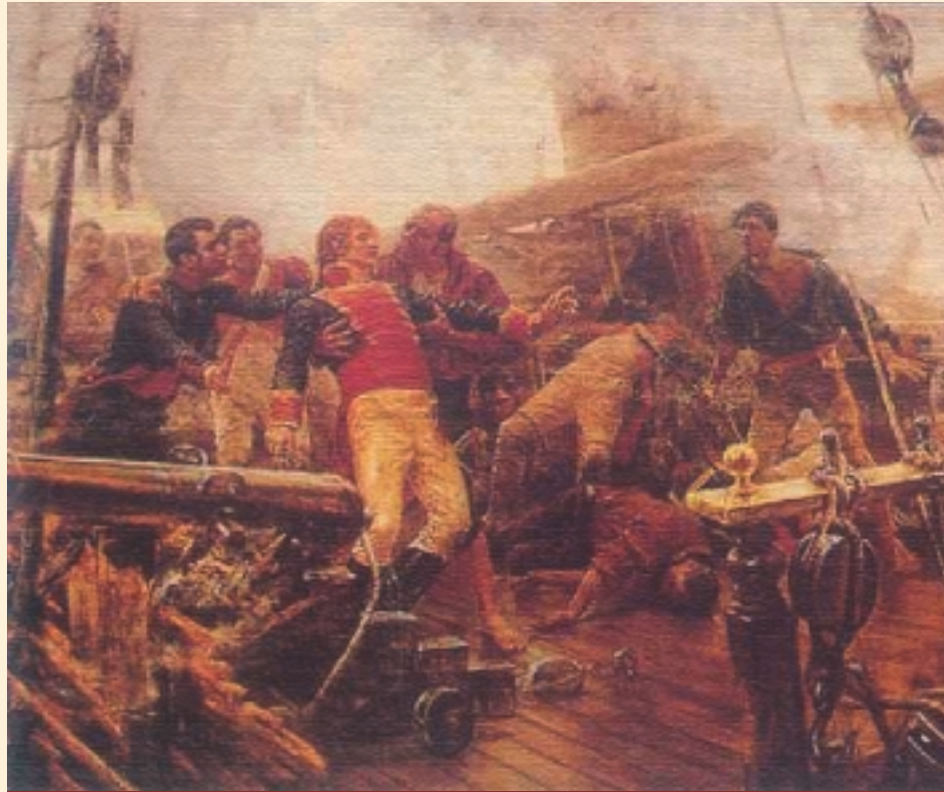
Muerte del Brigadier Churruca