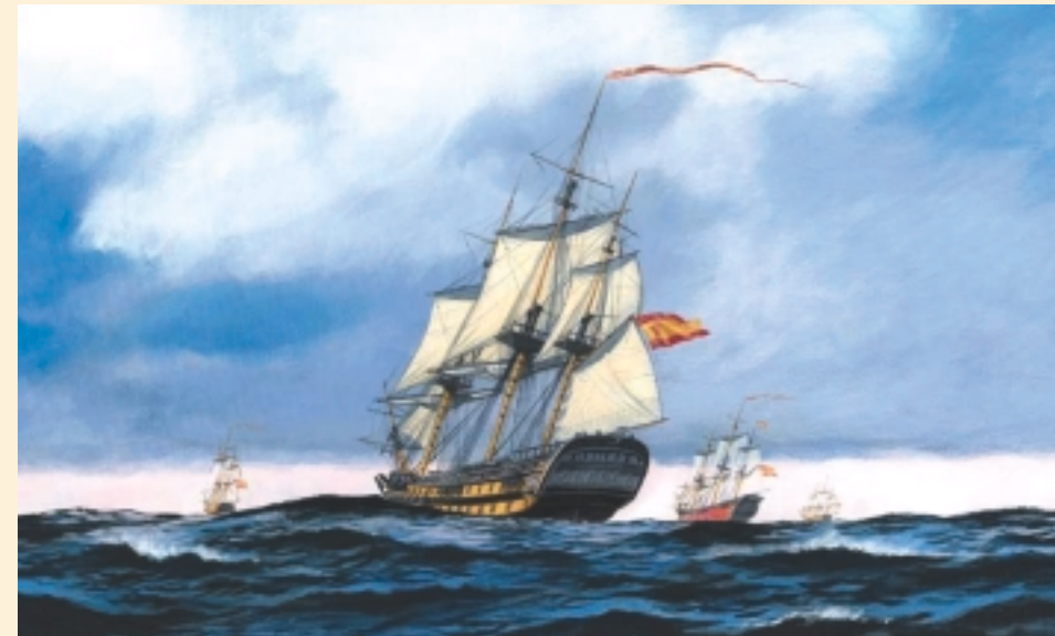
Navío San Juan Nepomuceno

En su primer viaje con destino a Ferrol se informa muy bien sobre las propiedades del buque. Gobierna bien y es muy descansado a la cabezada y balances. Su mayor andar a un largo son 6 millas y media con todo el aparejo y viento fresco, mientras